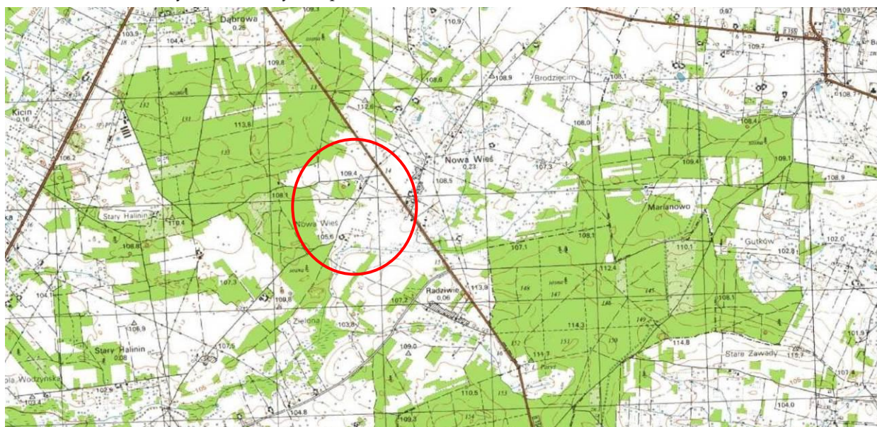
Rys. 1. Schematyczne położenie obszarów Planu w sołectwie Nowa Wieś