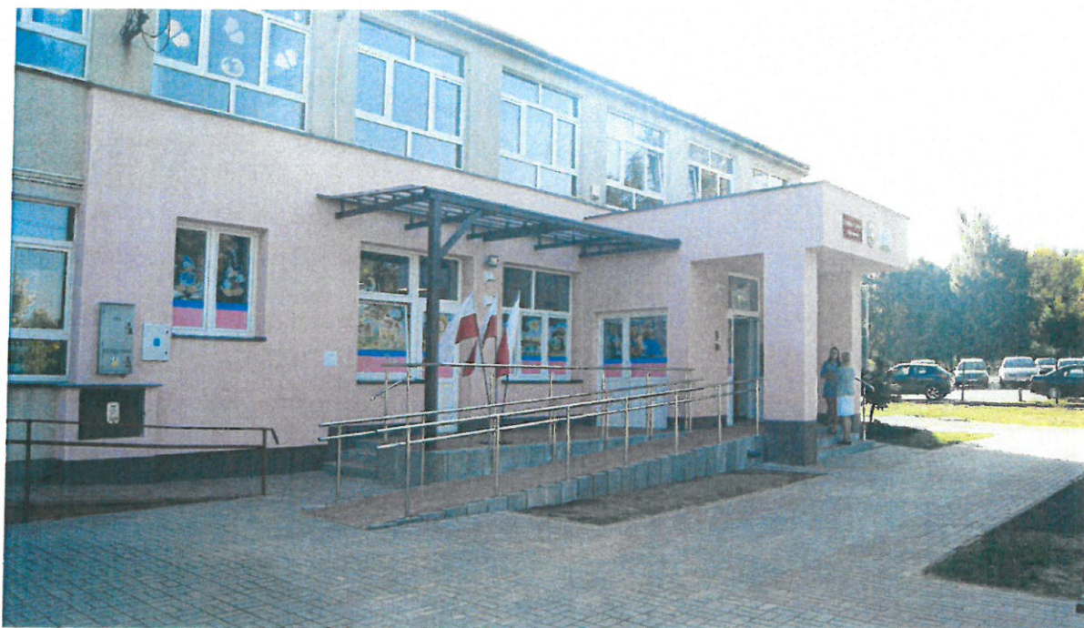
Zdjęcie nr 5: Żłobek w Kraszewie