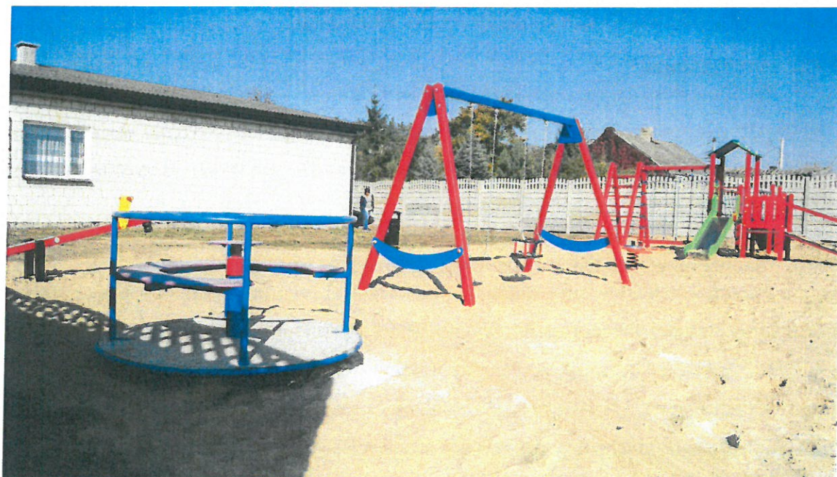
Zdjęcie nr 7: Plac zabaw w Kownatach Borowych