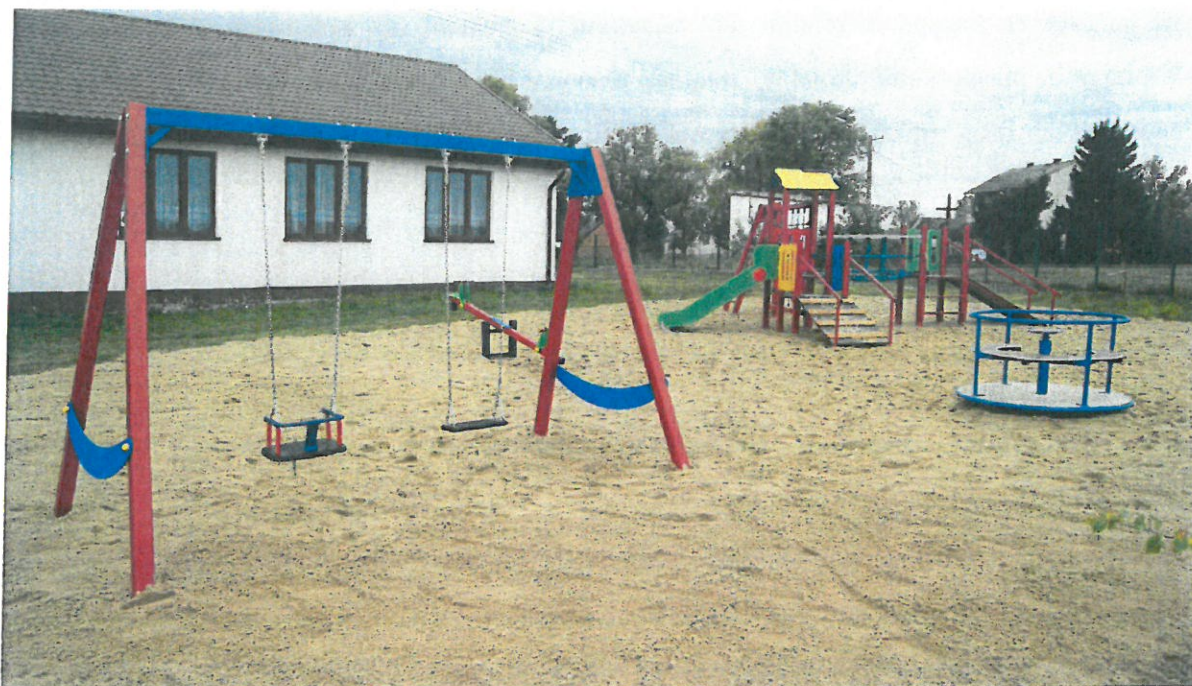
Zdjęcie nr 8: Plac zabaw w Nowej Wsi

Wykonano ogrodzenie działki komunalnej w Wojtkowej Wsi na kwotę 24 293,40 zł . Zakończono budowę siłowni zewnętrznej w Ojrzeniu, gdzie łączne koszty zamknęły się w kwocie 279 954,27 zł.