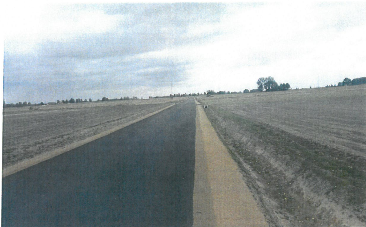
Zdjęcie nr 10: Droga Kraszewo – Łębki Wielkie

wynosi ponad 2,7 mln złotych, zaś kwota dofinansowania unijnego to ponad 1,85 mln złotych.