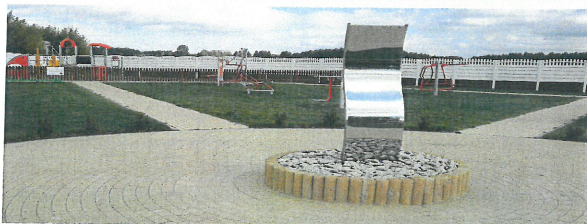
Zdjęcie nr 1 i 2: Otwarta Strefa Aktywności W Ojrzeniu