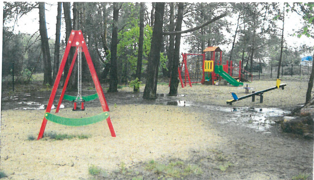
Zdjęcie nr 6: Plac zabaw Dąbrowa