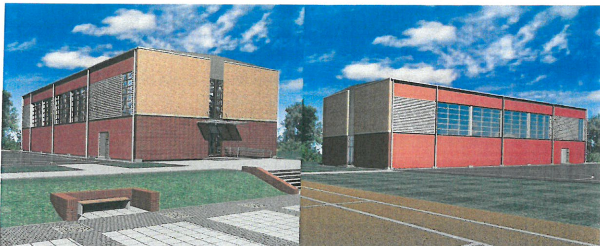
Zdjęcie nr 9: Wizualizacja Sali sportowej (grafika pochodząca z dokumentacji projektowej)

realizacje. Jest to z pewnością niemały sukces, biorąc pod uwagę ogólny koszt przedsięwzięcia - przekraczający 5 mln. złotych, oraz pozyskana kwotę dofinansowania z Ministerstwa Sportu i Turystyki – przekraczającą 3 mln. złotych. Realizacja zaplanowana jest na lata 2019 – 2020, z otwarciem obiektu w 2020 r.