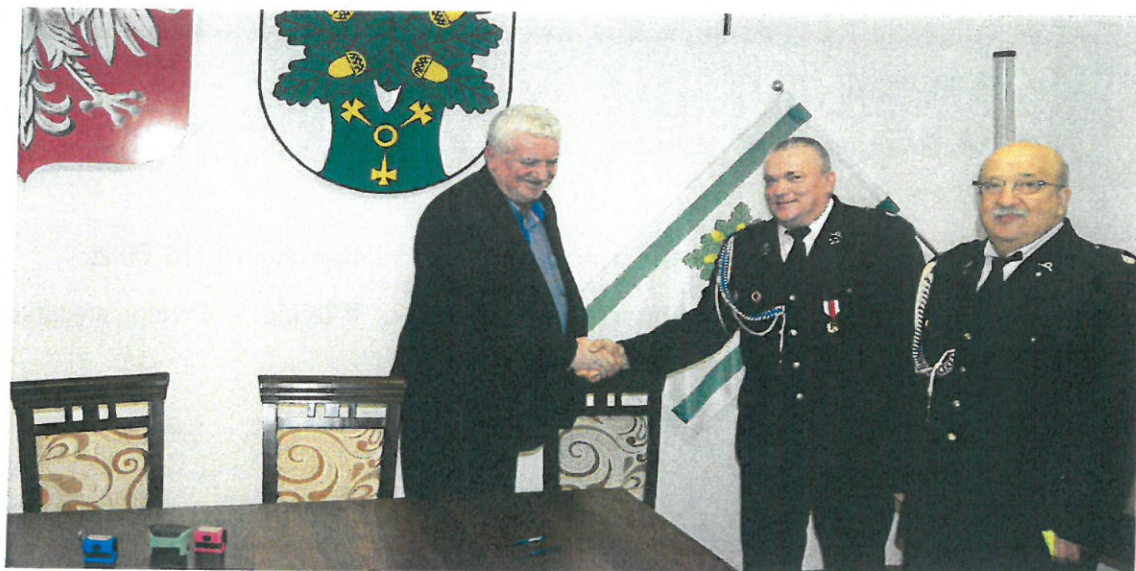
Zdjęcie nr 4: przekazanie dofinansowania na zakup sprzętu OSP jednostkom z terenu Gminy Ojrzeń