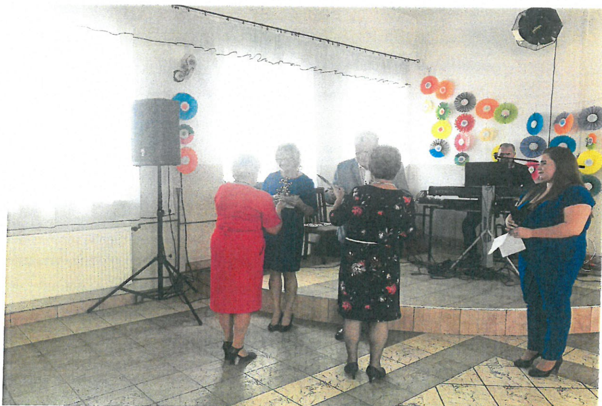
Zdjęcie nr 3: Działalność SENIOR+